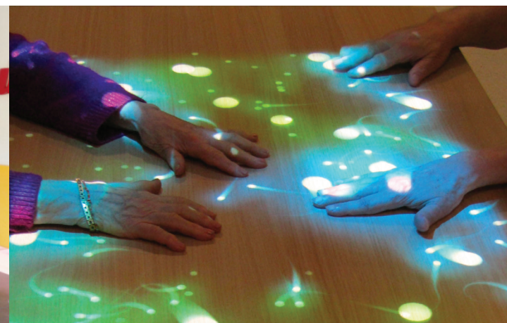
Des activités ludiques TABLE TOVERTAFEL