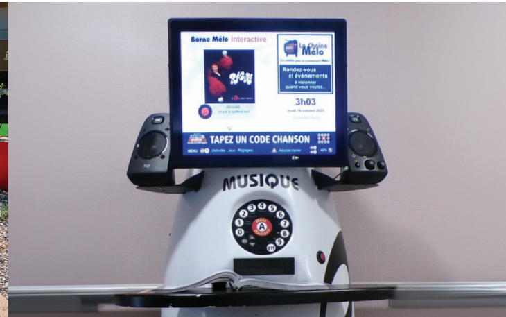
Des équipements interactifs BORNE MÉLO