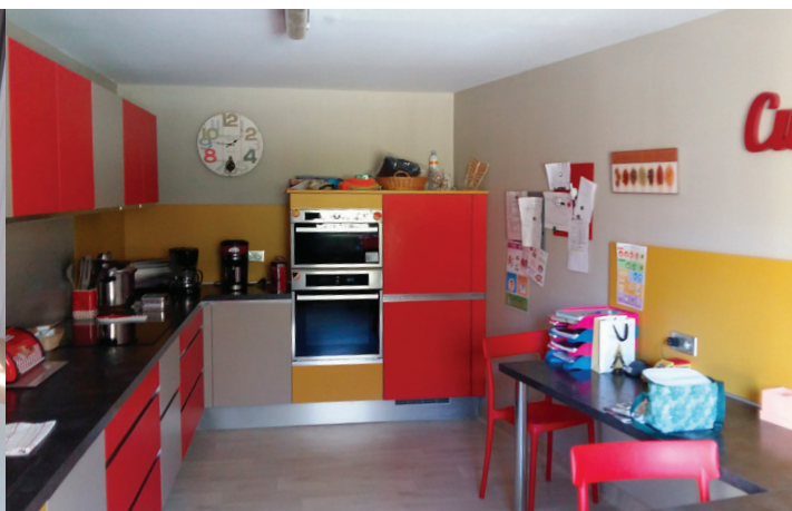
Des espaces de convivialité CUISINE PASA