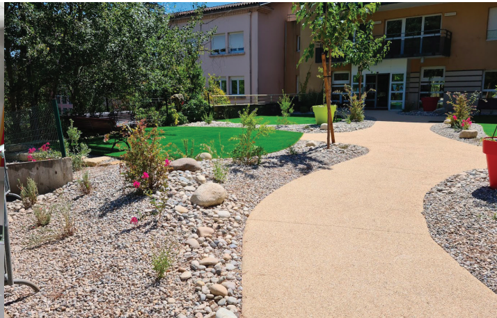
Un environnement paisible JARDIN