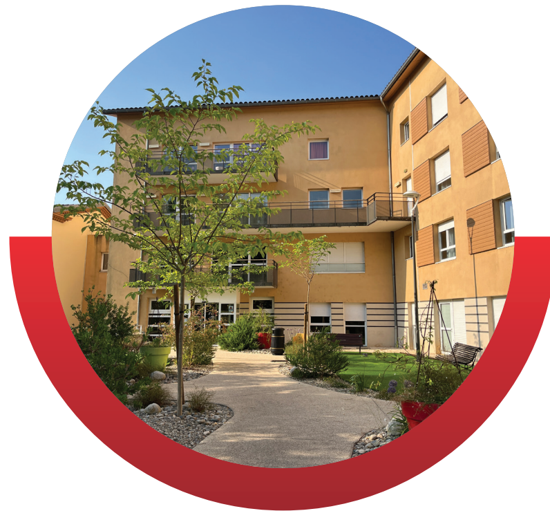
SAMDO POMAREDE (EHPAD)