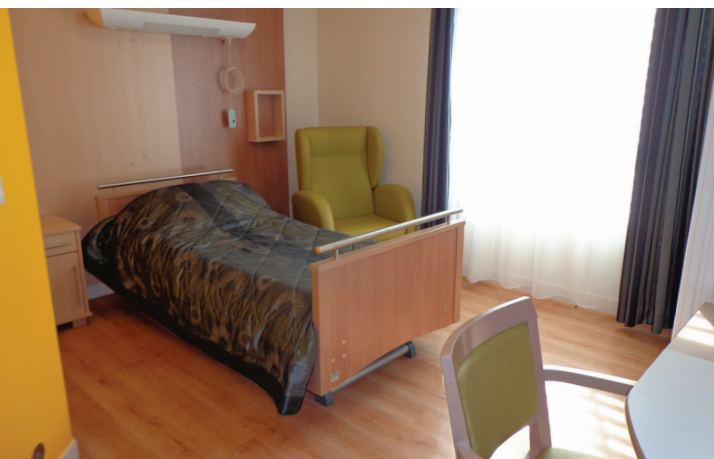
Des chambres spacieuses et lumineuses CHAMBRE