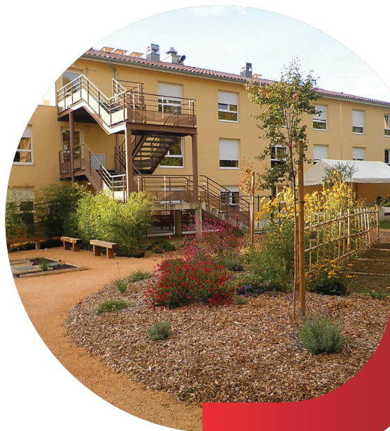
SAMDO ROCHEBELLE (EHPAD)