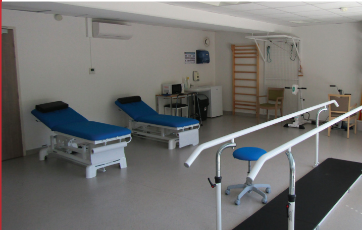
Des infrastructures adaptées SALLE KINÉ